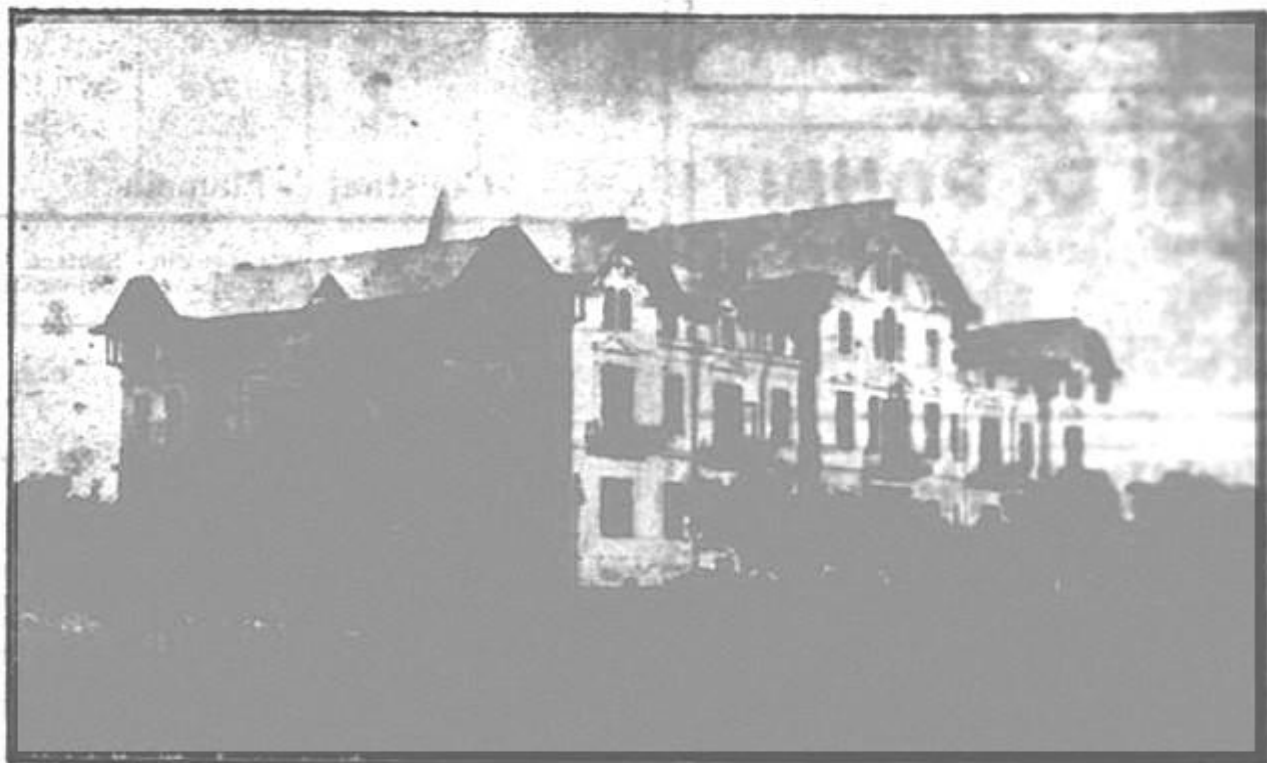
CARMEN-SYLVA - Marele Hotel MOVILA Inchiriază camere cu tot confortul modern și pensiune cu 300, 350 și 400 lei pe săptămână

In stațiunea balneară Techirghiol Vizitați vechiul și cunoscutul Restaurant Bodegă și Bărie La IONEL incurează lumea Bucătărie Națională - Grătar special - la prânz și seara - CIORBĂ DE BURTĂ - TUSLAMA Zilnic pește proaspăt - Bere specială - Vinuri superioare - Orchestră clasică - Deschis la orice oră din noapte N. B. Se pînă se come zilnic - Se servește mâncări a la minu - Prețuri populare